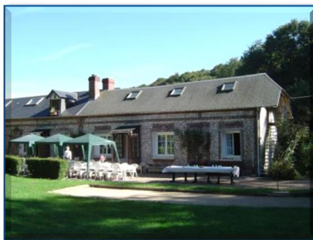
La maison de Vaucottes

Les bénévoles de l'association effectuent les travaux nécessaires à la transformation de ce bâtiment de ferme en un gîte d'étape destiné à recevoir d'une part les membres du mouvement, d'autre part les randonneurs parcourant les sentiers du littoral normand.